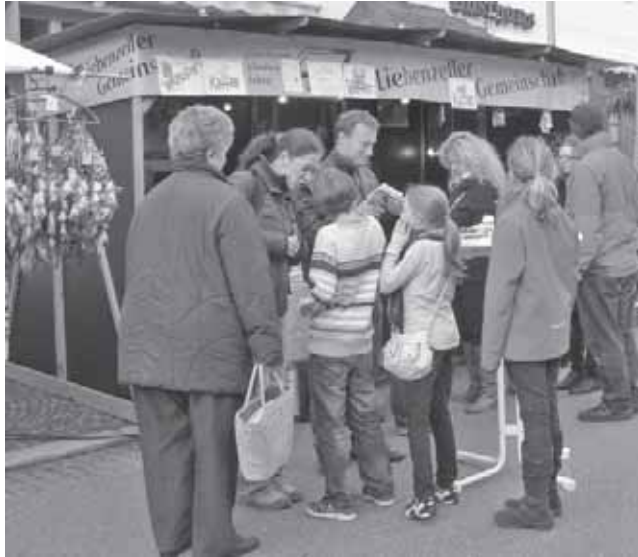
Stand der Liebenzeller Gemeinschaft am Katharinenmarkt

Stand der Liebenzeller Gemeinschaft Was gibt's bei uns?