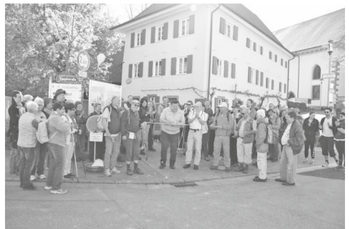
In 2016 wurde der Panoramaweg Augenweide im Rahmen des 1.000-jährigen Dorfjubiläums feierlich eröffnet.

Wir freuen uns auf viele Wanderer in und um Malterdingen!!