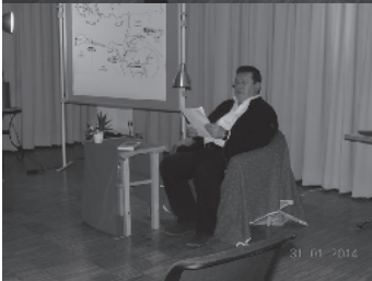
Auf ein Neues im nächsten Winter!