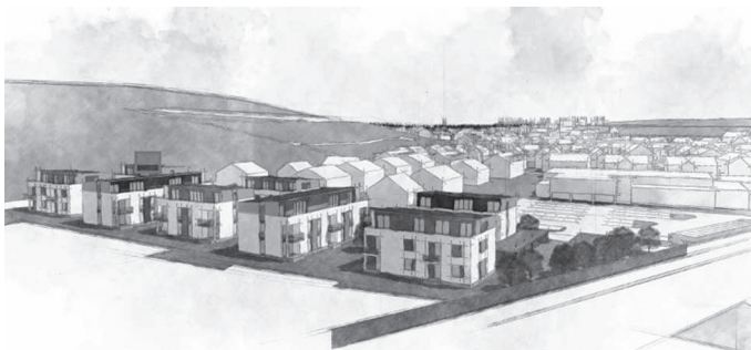
Städtebaulicher Vorentwurf (kuhs architekten, 2017)

Die stetige Ausweisung neuer und insbesondere attraktiver Wohnbauflächen ist – wie in vielen Städten und Gemeinden in der Region Freiburg – auch für die Gemeinde Malterdingen ein zentrales Thema. Um den steigenden Bedarf an Wohnbauflächen decken zu können, plant die Gemeinde deshalb zeitnah das Wohnquartier „Kleb II“ aufzusiedeln.