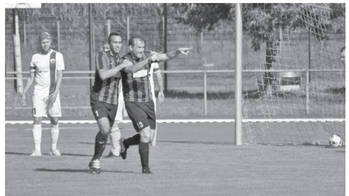
Torjubel des Torschützen zum 1:0

Ähnliches Bild auch in Durchgang 2, die besseren Chancen hatte weiterhin die Heimmannschaft, war aber inzwischen ebenfalls etwas zu fahrig im Abschluss und vergab so das vierte Tor. Dadurch kam eine Viertelstunde vor Schluss der Gegner nochmal besser ins Spiel und erzielte zu diesem Zeitpunkt nicht unverdient den 3:1 Anschlusstreffer. Auch wenn der Gegner dadurch nochmal Auftrieb bekam, die ganz dicken Chancen zum 2:3 gab es nicht mehr weil die SG Defensive insgesamt gut stand. So stand am Ende ein ungefährdeter Sieg, der bei besserer Chancenverwertung auch etwas höher hätte ausfallen können. Eine durchaus gelungene Generalprobe für das erste Punktspiel kommenden Sonntag in Achkarren, dort drifft man auf einen sicher hoch motivierten Aufsteiger