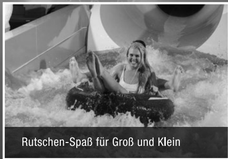
Rutschen-Spaß für Groß und Klein