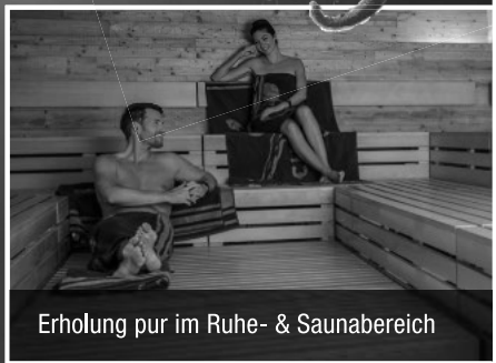
Erholung pur im Ruhe- & Saunabereich