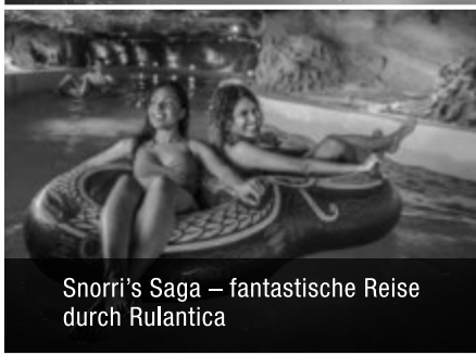
Snorri's Saga – fantastische Reise durch Rulantica